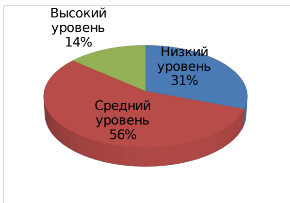
Рис. 1. Диаграмма уровней по показателю – сформированность представлений обучающихся о культурном наследии народов России (начальная диагностика)

3. Низкий уровень: не имеет представления.