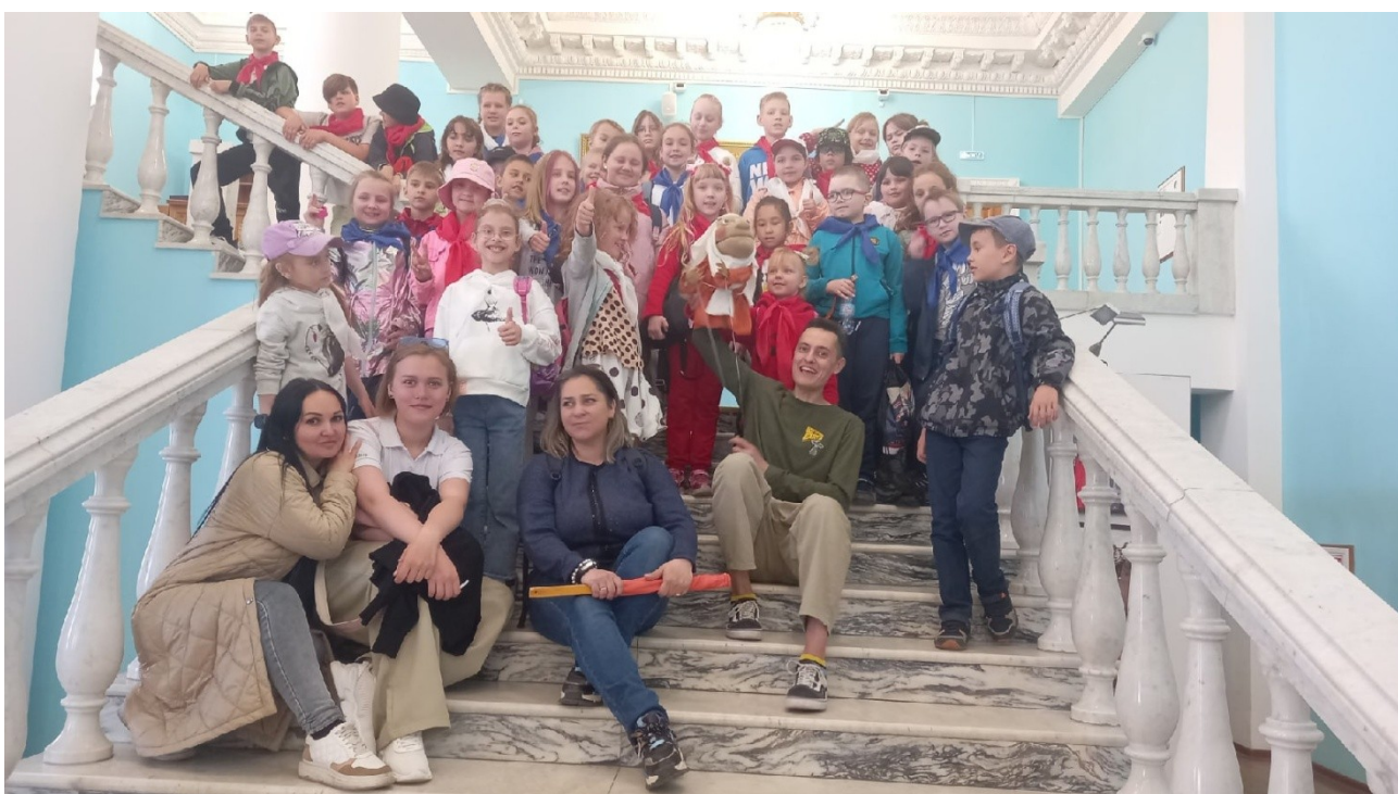
Челябинская государственная филармония