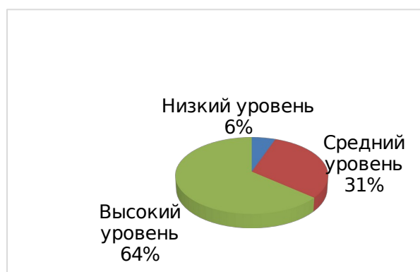
Рис. 12. Диаграмма уровней по показателю – сформированность потребности в ведении здорового и безопасного образа жизни (итоговая диагностика)