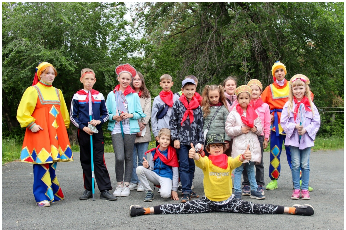
Праздник народного головного убора