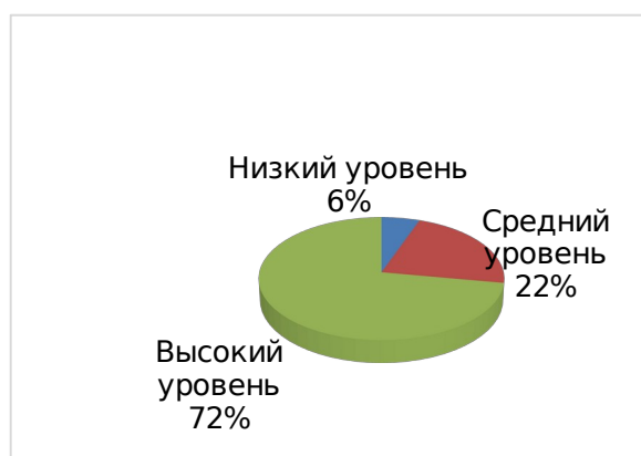
Рис. 4. Диаграмма уровней по показателю – проявление творческого мышления, художественных, музыкальных, литературных способностей (итоговая диагностика)