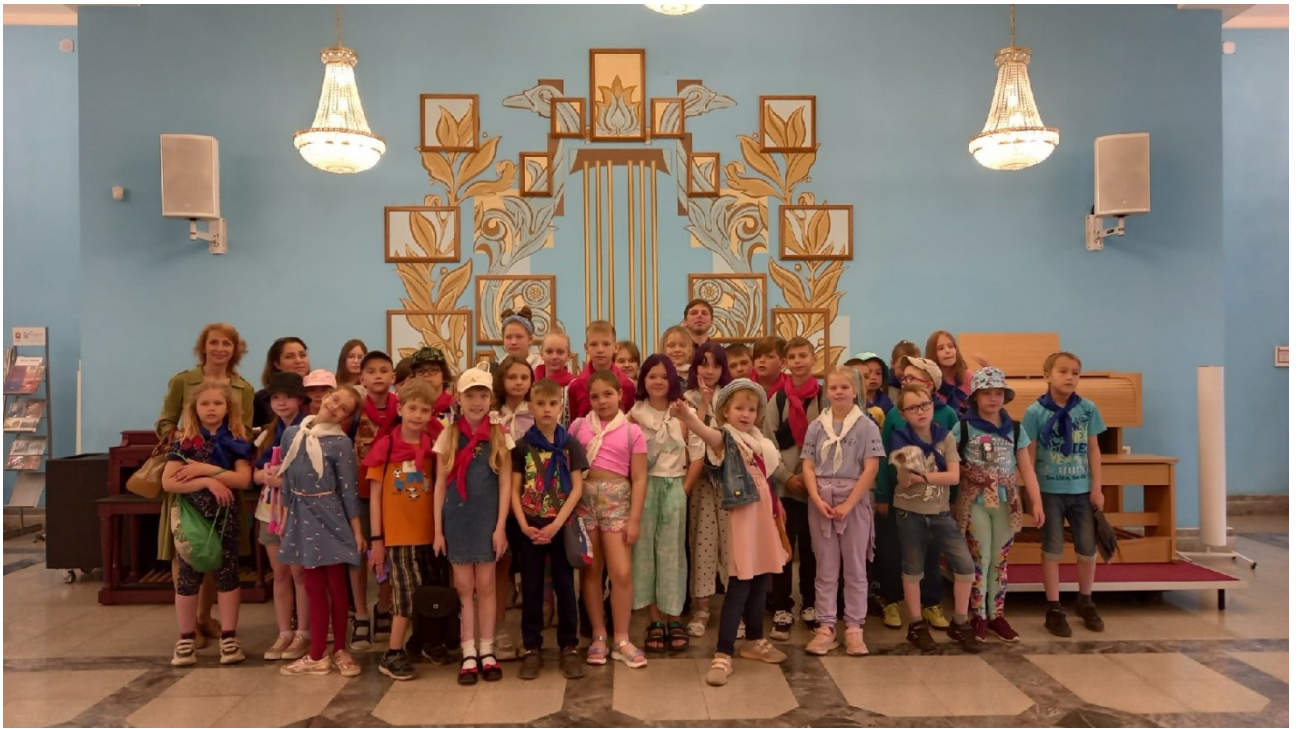
Посещение зала органной и камерной музыки «Родина»