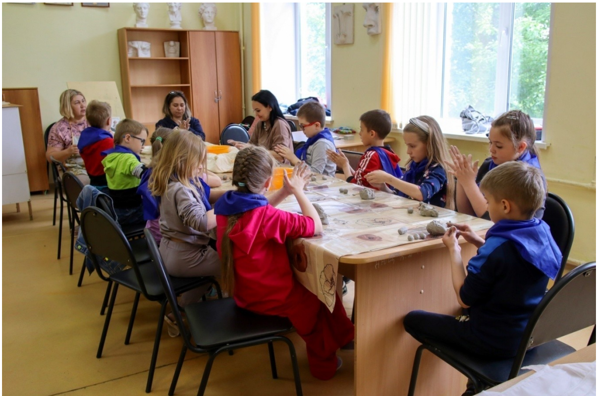
Занятие в мастерской «Волшебная глина»