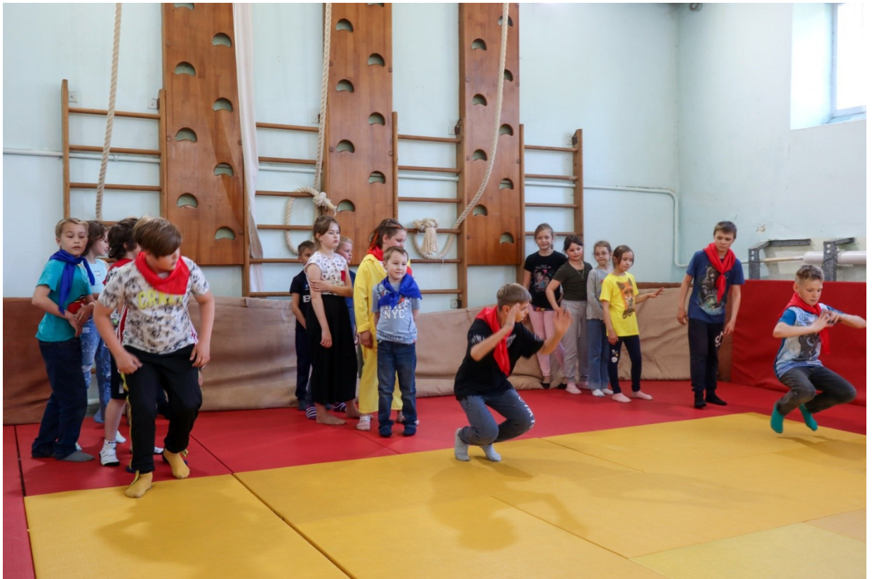
Занятие в мастерской «Богатырская сила»