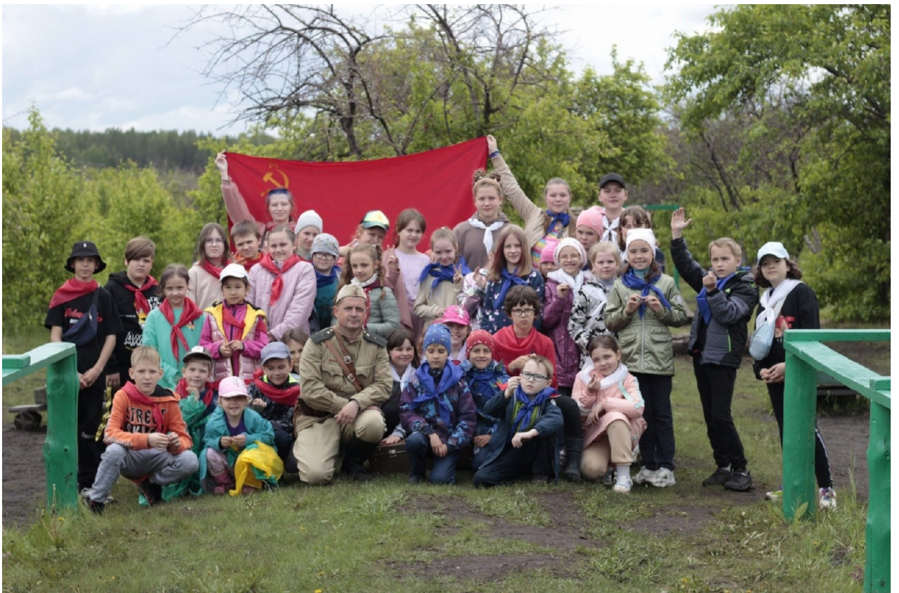
«Зарница» в парке исторической реконструкции «Гардарика»