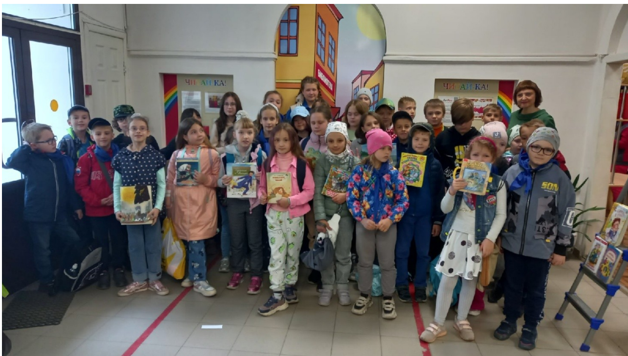
День русского языка