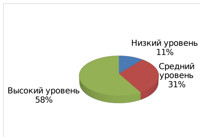
Рис. 2. Диаграмма уровней по показателю – сформированность представлений обучающихся о культурном наследии народов России (итоговая диагностика)

2. Показатель – проявление творческого мышления, художественных, музыкальных, литературных способностей (метод оценки: наблюдение).