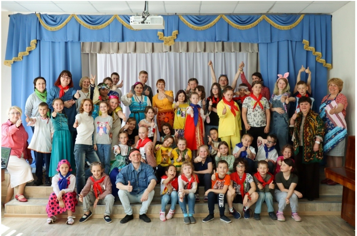
Открытие смены «Курс на взлёт! Сохраняя традиции»