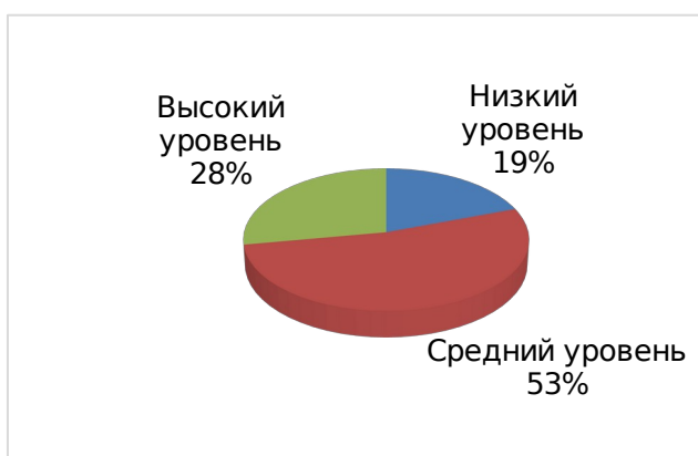
Рис. 3. Диаграмма уровней по показателю – проявление творческого мышления, художественных, музыкальных, литературных способностей (начальная диагностика)