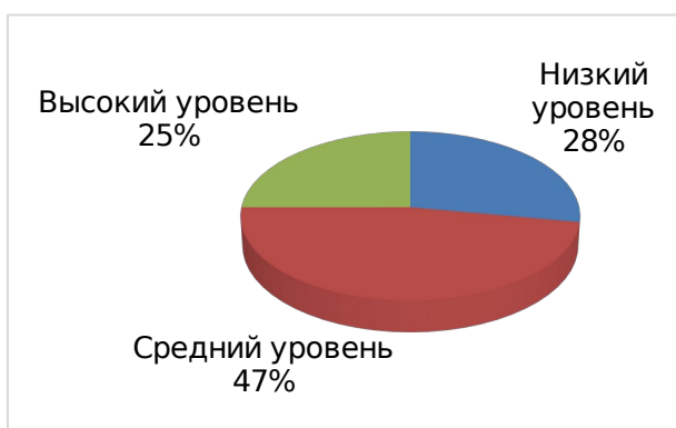
Рис. 11. Диаграмма уровней по показателю – сформированность потребности в ведении здорового и безопасного образа жизни (начальная диагностика)