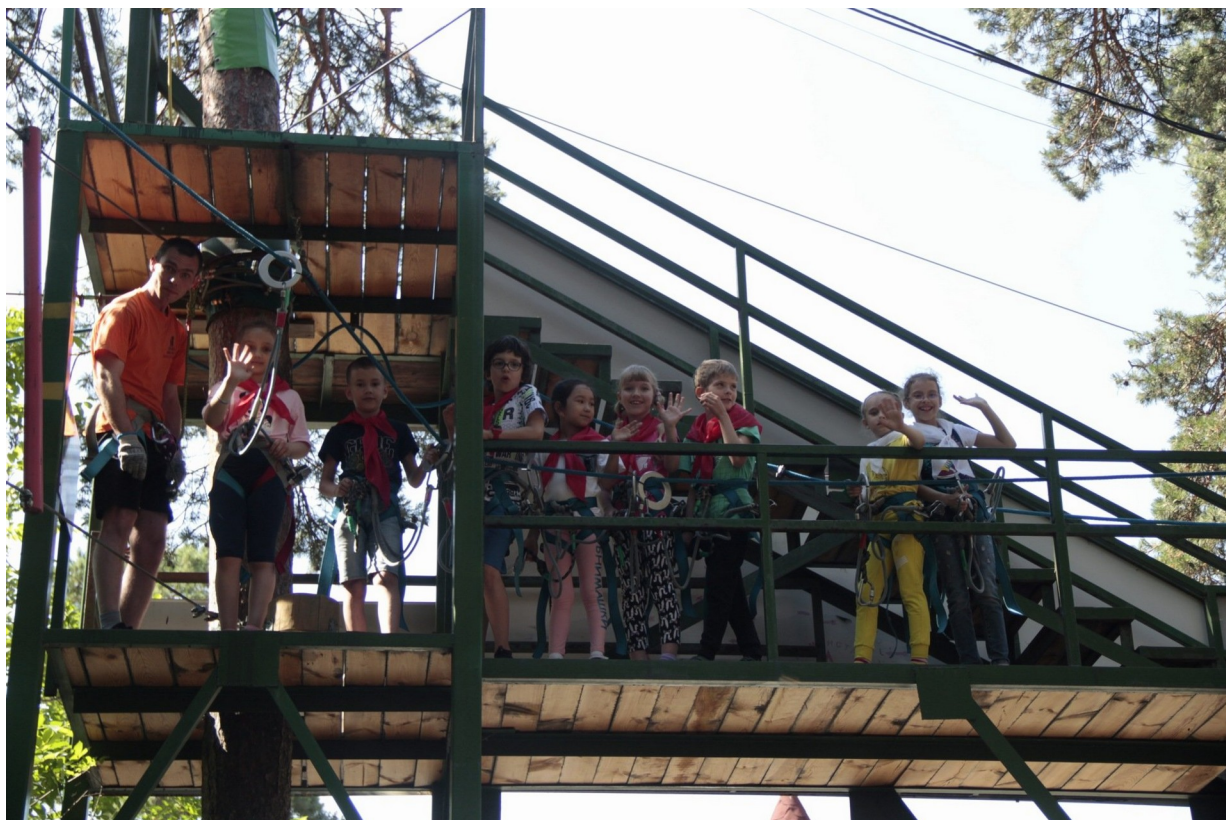
Прохождение трасы в веревочном парке «Лесной экстрим»