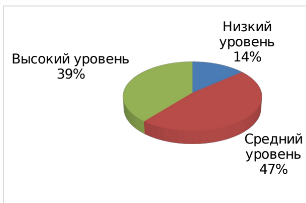
Рис. 5. Диаграмма уровней по показателю – проявление познавательной активности у воспитанников (начальная диагностика)