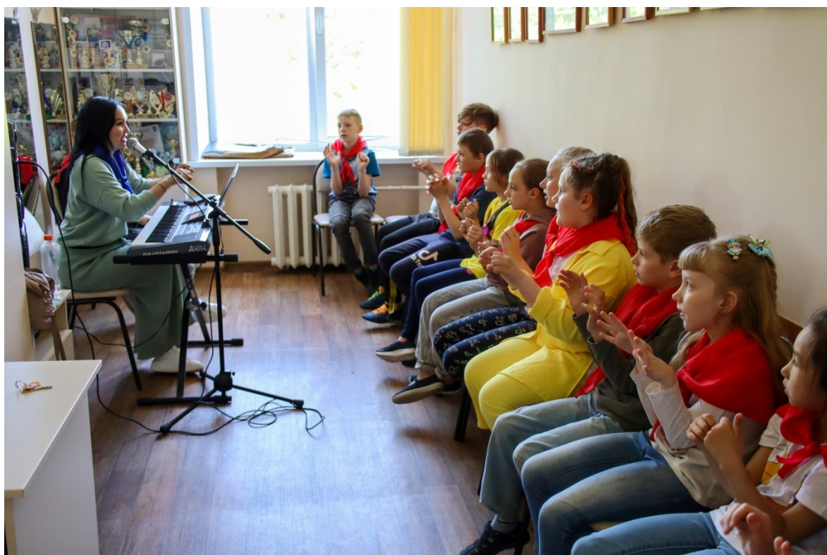
Занятие в мастерской «Озорные ложки»